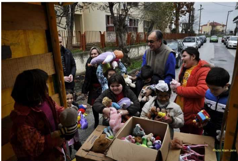
Livraison des jouets et vêtements aux foyers Paidiki Stegi, Gianoulis et Chara