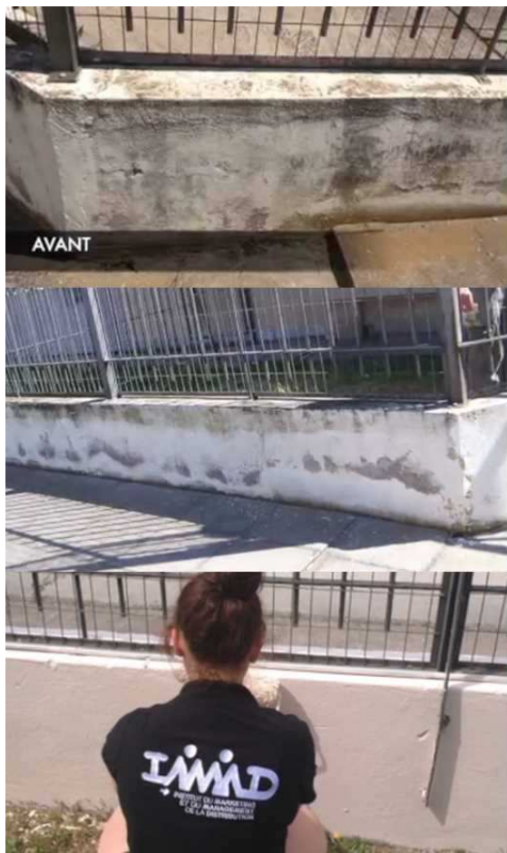
Les étudiants de l'IMMD rénovent le Foyer Eleftheria